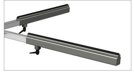
مسطح مضاد للترحلق من مادة الPVC