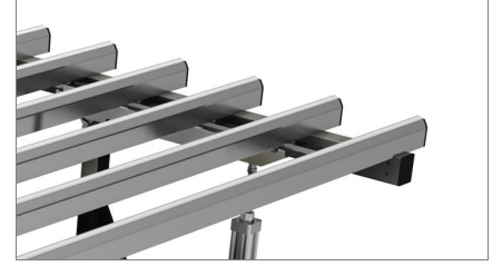
الصلبة المانعة PVC مسطحات دعم من مادة ال للانزلاق