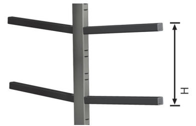
مساند وسطى قابلة للضبط

ان التخطيط لتدفق سليم للمواد سواء كانت شبه مُصنعه ، خاصة في مرحلة التركيب أو منتجات نهائية يلعب دوراً هاماً في إتران وتحسين الدورة الانتاجية . ان خط الدعم اللوجستي ل Emmegi يوفر للمؤسسات الاجابة المناسبة على جميع حاجاتها للتخزين و التنقل و التجميع . Stack ترولي مخصص لنقل وتخزين القطع أفقياً .