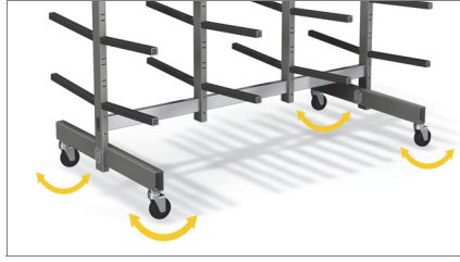
عجلات حرة الحركة