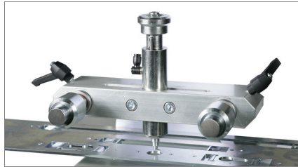
Ръчен измервателен накрайник 01