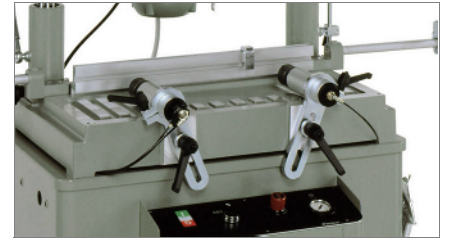
Хоризонтални стеги 02