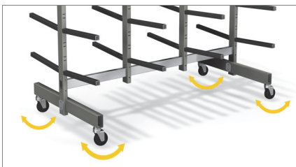
Колела, въртящи се на 360° 01