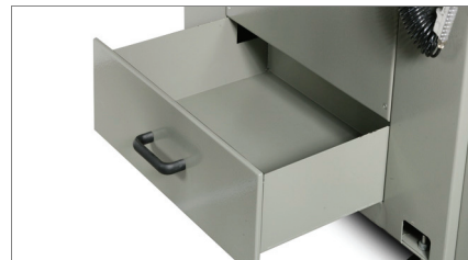
Opsamling af spåner