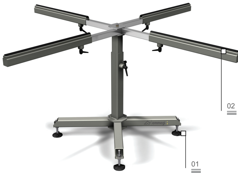
Overflade af skridsikker PVC 02

Projekteringen af et korrekt materialeflow spiller en stor rolle ved rationaliseringen og optimeringen af bearbejdningen. Dette gælder uanset om der er tale om halvfabrikata, montagedele eller færdige produkter. Emmegis logistiklinje giver virksomhederne et konkret svar på alle behov for opbevaring, transport og montering.