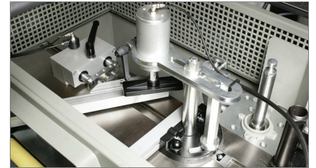
Kiinnitinyksikkö ja ei-suorakulmat 02