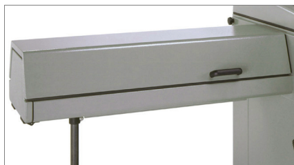
Tunnel insonorisé 01