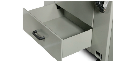
Bac à copeaux 02