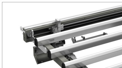
Système de blocage 01