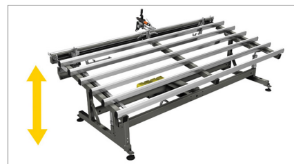
Hauteur réglable de la table de travail 02