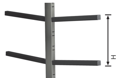
Bras de support centraux 03 réglables

La mise au point d'un flux correct des matériels, qu'il s'agisse de produits semi-finis, de composants en cours de montage ou de produits finis, revêt une importance primordiale dans le processus de rationalisation et d'optimisation du cycle de production. La ligne Logistique d'Emmegi offre aux entreprises une réponse concrète à toutes les exigences de stockage, de manutention et d'assemblage. Stack est un chariot pour le transport et le stockage horizontaux de profilés.