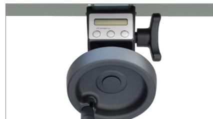
Ηλεκτρονική ένδειξη MV 02