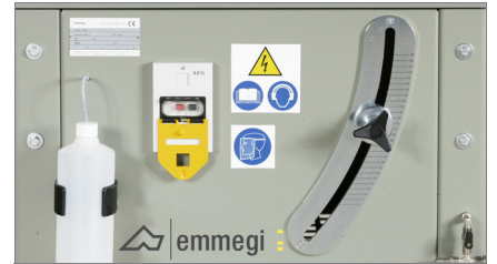
Βαθμονομημένη κλίμακα 02