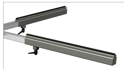
Piano in PVC antiscivolo 02