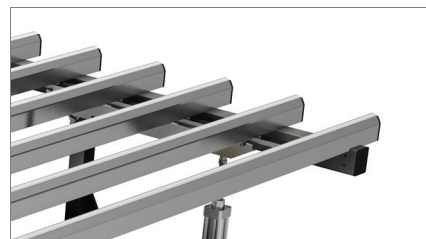
Piani di appoggio in PVC duro antifrizione 02