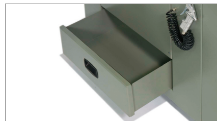
Odbiór wiórów 02