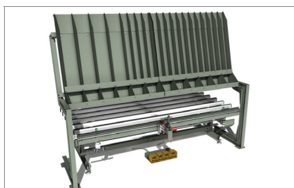
Połączenie ze stołem montażowym 03