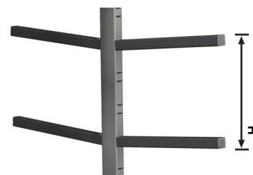
Regulowane wsporniki środkowe

Dla racjonalnej organizacji cyklu produkcyjnego ważne jest prawidłowe rozplanowanie przepływu materiałów, zarówno półproduktów, jak i detali w fazie montażu oraz produktów gotowych. Seria maszyn „Logistyka” firmy Emmegi jest odpowiedzią na potrzeby firm związane z magazynowaniem, transportem wewnętrznym i montażem. Stack to wózek przeznaczony do transportu i składowania profili ułożonych poziomo.