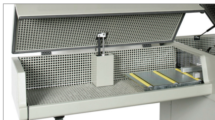
Insonorização do túnel 01