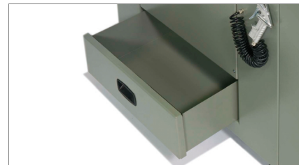
Colheita de cavacos 02