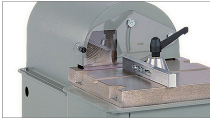
Proteção do disco