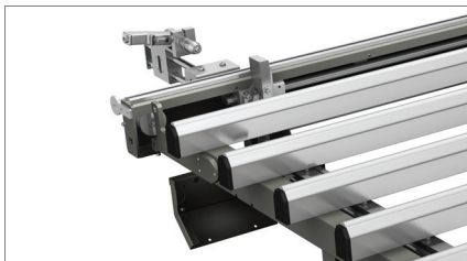
Sistema de fixação