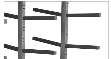
Superfícies de contato 02