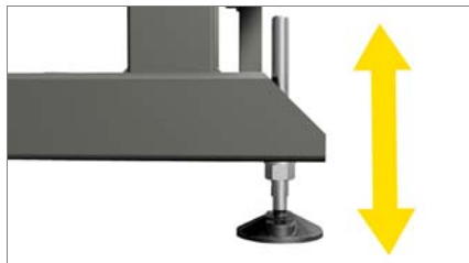
Регулируемые ножки 01