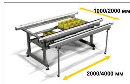
Опорный стол, раздвигающийся по ширине и длине