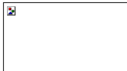
Регулируемая высота рабочего стола 02