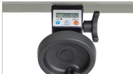
Цифровое считывающее устройство VIS 01