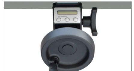
Цифровое считывающее устройство MV 02