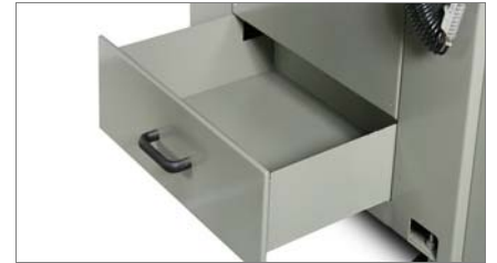
Cajón recoge virutas 02