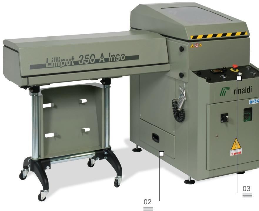
Cajón recoge virutas 02

Fresadora retestadora horizontal, con avance electropneumatico. Fresado fuera escuadra (+45°/90°/-45°). Un variador electrónico hace variar la velocidad de rotación de la herramienta: de esta manera, mejora la calidad de mecanizado en el perfil pintado y fuera escuadra. Cambio rápido del grupo de fresado con mando neumático. Plano de apoyo perfil antirrayas. Zona de mecanizado insonorizada y protegida integralmente por cárteres. El túnel insonorizado (A 1.100 o 2.000 mm), con accionamiento automático, reduce el ruido emitido por la máquina hasta 75 dB aproximadamente (sólo en caso de fresados en escuadra a 90°). El tope de profundidad, abatible automáticamente, evita el choque contra la pieza durante su avance.