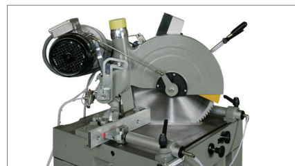
Zona de corte