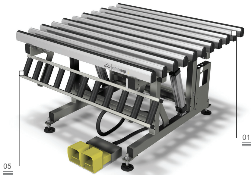
Tippbar uppläggningsyta 02

Ett arbetsbord designat för montering av fönsterbågar och fönsterkarmar. Tippbar arbetsyta från 0° (horisontellt) till 85°, med pneumatisk växling mellan uppläggningsytan i mjuk skyddsbelagd PVC (för monteringsfasen) och uppläggningsytan i hård friktionsfri PVC (för hanteringsfasen). Rullbanan är manuellt tippbar och ställbar i höjddled (från 170 till 460 mm) oberoende av arbetsytans höjd. Arbetsytan är ställbar i höjddled från 895 till 965 mm och stödfötterna är försedda med hål för förankring i golvet.