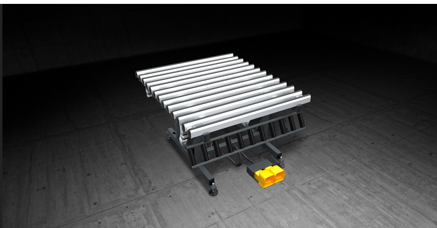
Table pour l'assemblage d'ouvrants et de dormants. Plan de travail pivotant de 0° (horizontal) à 85°, avec échange pneumatique entre la surface d'appui en PVC souple (pour la phase d'assemblage) et la surface d'appui en PVC dur antifriction (pour la phase de déplacement). Possibilité d'escamoter manuellement le chemin d'amenage tout comme d'en régler la hauteur (de 170 à 460 mm), et ce, quelle que soit la hauteur du plan de travail. La hauteur du plan de travail est réglable entre 895 et 965 mm et les pieds sont percés pour l'ancrage au sol.