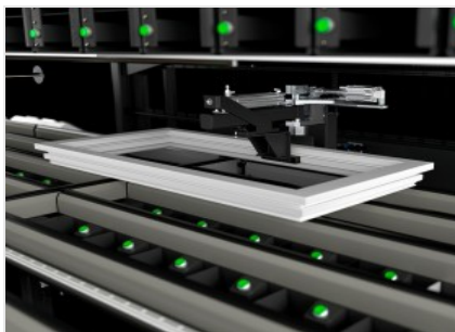
Table de montage des ferrures équipée de deux stations de vissage indépendantes pour travailler simultanément sur deux côtés du cadre, avec la possibilité d'insérer également un troisième chargeur pour les vis spéciales.