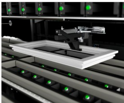
Table de montage des ferrures équipée de deux stations de vissage indépendantes pour travailler simultanément sur deux côtés du cadre, avec la possibilité d'insérer également un troisième chargeur pour les vis spéciales.