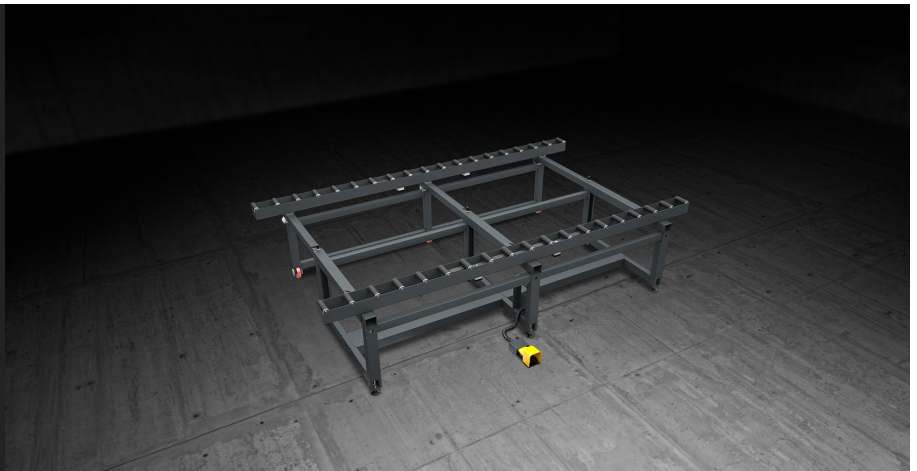
Table modulaire de grandes dimensions conçue pour le montage et la manutention en ligne de cadres de murs-rideaux. Equipée de deux chemins d'amenage recouverts d'une gaine en PVC souple; le réglage de la distance entre les deux chemins d'amenage est fonction de la largeur de la pièce. Un système à actionnement pneumatique permet de bloquer les rouleaux durant les phases de travail.