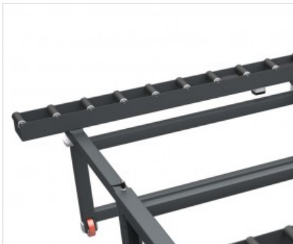
Table à rouleaux

La commande par pédale permet le serrage des rouleaux, de sorte que la cellule de façade puisse être traitée en toute sécurité. Grâce à la commande de déblocage ultérieure, la cellule peut être déplacée, en profitant pleinement du glissement du rouleau.