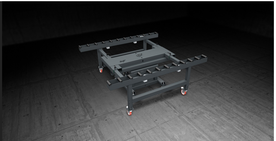
Table modulaire conçue pour le montage et la manutention en ligne de cadres de murs-rideaux. Equipée de deux chemins d'aménagement recouverts d'une gaine en PVC souple; le réglage de la distance entre les deux chemins d'aménagement en fonction de la largeur de la pièce. Un système à actionnement pneumatique permet de bloquer les rouleaux pendant les phases de travail. La table peut pivoter de 360° pour faciliter les opérations de montage et de scellement du cadre ; une commande pneumatique verrouille la position angulaire.