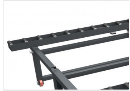
Table à rouleaux

SPIN BENCH peut s'étendre de 1 000 mm à 2 500 mm. Une fois la position des pistes déterminée, des poignées de serrage permettent de fixer le convoyeur à rouleau en position, offrant ainsi une grande polyvalence.