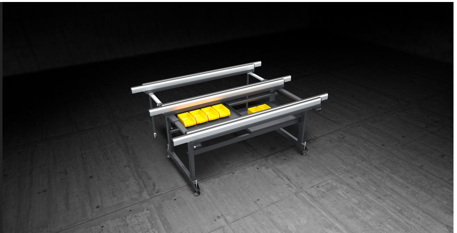
Table conçue pour n'importe quelle opération d'assemblage des menuiseries. Les plateaux coulissants extensibles permettent travailler des cadres de n'importe quelle dimension et des structures particulièrement encombrantes en toute sécurité.